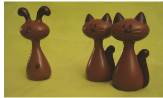
Chien & Chats (9,70 €)