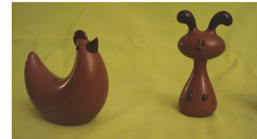
Poulette (15,50 €) & Chien (9,70 €)