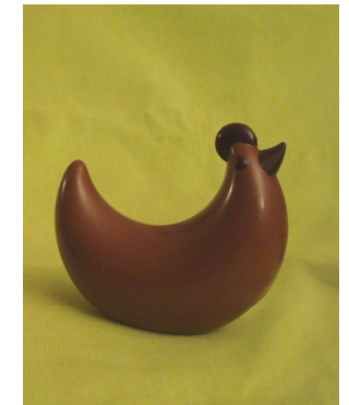
Poulette (15,50 €)