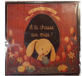
Carte en chocolat rectangle (130 g 11,30 €)