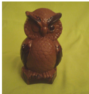
Grand Hibou clignant (33,80 €)