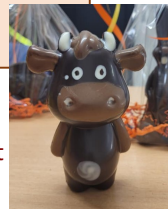
Boîte en fer poule (11 €)

2 œufs praliné + friture = 70 g de chocolat