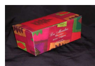
décor non contractuel (selon disponibilités)